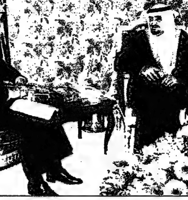
المعال السعودي للنفط في لقاء مع رئيس الوزراء الياباني يوتارو هاشيموتو

تحت المملكة العربية السعودية ورئيس الوزراء الياباني يوتارو هاشيموتو على زيادة مشترياتها اليابانية من النفط السعودي في الوقت الذي تتفاوض فيه طوكيو والرياض على تجديد العمل باتفاق قطري جديد. وقال يوتارو هاشيموتو ان زيادة مشترياتها اليابانية من النفط السعودي في الوقت الذي تتفاوض فيه طوكيو والرياض على تجديد العمل باتفاق قطري جديد. وقال يوتارو هاشيموتو ان زيادة مشترياتها اليابانية من النفط السعودي في الوقت الذي تتفاوض فيه طوكيو والرياض على تجديد العمل باتفاق قطري جديد. وقال يوتارو هاشيموتو ان زيادة مشترياتها اليابانية من النفط السعودي في الوقت الذي تتفاوض فيه طوكيو والرياض على تجديد العمل باتفاق قطري جديد.